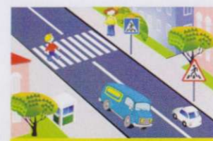
НАЗЕМНЫЙ ПЕШЕХОДНЫЙ ПЕРЕХОД ОБЪЕЗНАЧАЕТСЯ СПЕЦИАЛЬНЫМИ ДОРОЖНЫМИ ЗНАКАМИ И РАЗМЕТКОЙ

Вот обычный переход. По нему идёт народ. Здесь специальная разметка, «Зеброю» зовётся метко! Белые полосы тут Через улицу ведут! Знак «Пешеходный переход» Где на «зебре» пешеход, Ты на улице найди И под ним переходи!