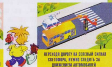
ПЕРЕХОДИ ДОРОГУ НА ЗЕЛЁНЫЙ СИГНАЛ СВЕТОФОРА, НУЖНО СЛЕДИТЬ ЗА ДВИЖЕНИЕМ АВТОМОБИЛЕЙ