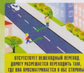
ОТСУТСТВУЕТ ПЕШЕХОДНЫЙ ПЕРЕХОД, ДОРОГУ РАЗРЕШАЕТСЯ ПЕРЕХОДИТЬ ТАМ, ГДЕ ОНА ПРОСМАТРИВАЕТСЯ В ОБЕ СТОРОНЫ

Чтобы возле перекрёстка Ты дорогу перешёл, Все цвета у светофора Нужно помнить хорошо! Загорелся красный свет — Пешеходам хода нет! Жёлтый — значит подожди, А зелёный свет — иди!