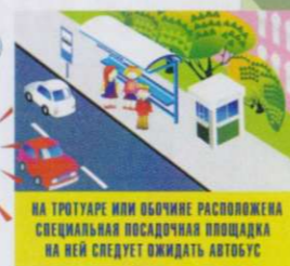
НА ТРОТУАРЕ ИЛИ ОБОЧИНЕ РАСПОЛОЖЕНА СПЕЦИАЛЬНАЯ ПОСАДОЧНАЯ ПЛОЩАДКА НА НЕЙ СЛЕДУЕТ ОЖИДАТЬ АВТОБУС