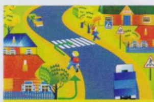
ПО ОБОЧИНЕ ДОРОГИ СЛЕДУЕТ ИДТИ НАВСТРЕЧУ ДВИЖЕНИЮ ТРАНСПОРТА