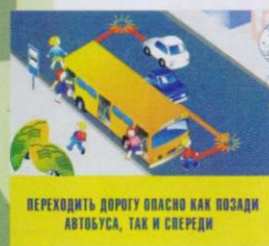
ПЕРЕХОДИТЬ ДОРОГУ ОПАСНО КАК ПОЗАДИ АВТОБУСА, ТАК И СПЕРЕДИ