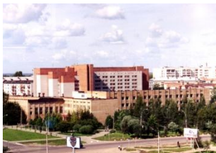
Институт. Основной корпус

Успешной реализации профессиональных образовательных программ в институте способствует четкая организация учебно-методической работы. Свыше 60% преподавателей имеют ученые степени и звания. В педагогическом арсенале – модульно-рейтинговая система обучения, деловые и ролевые игры, учения, экскурсии, олимпиады, конкурсы, что позволяет делать учебный процесс интереснее и ярче.