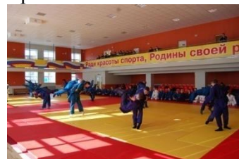
Занятия в спортивном комплексе

Систематическая занятость курсантов и студентов в различных формах внеучебной деятельности – хореографической, вокальной и театральной студиях, студии журналистики, духовом оркестре, внештатной роте почетного караула, спортивных секциях – позволяет развить творческие способности и физические возможности, умение проявлять инициативу и высокую личную организованность.