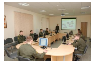
Центр дистанционного обучения

Интернет-ресурсы: vipe.vologda@mail.ru www.vipe-fsin.ru